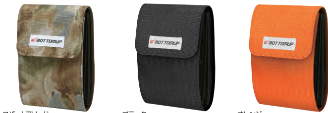
コバートアリッド