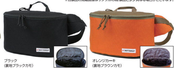
ブラック (裏地ブラックカモ)