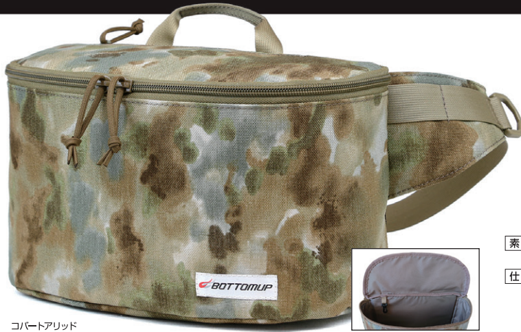
コバートアリッド

フルクリップ「インテイク」ボトムアップリミテッドエディション 8,700円(税別)